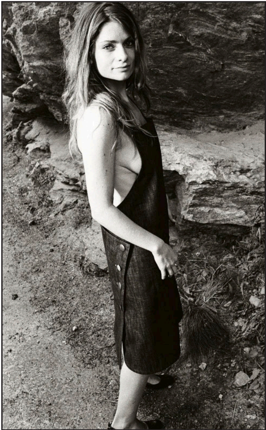
Der Kassenschlager: Trotz des stolzen Preises von 350 Franken verkauft sich das Schürzenkleid gut.