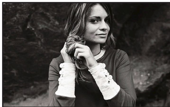
Die Manschetten: Ein Hingucker mit prägnanten Knöpfen.